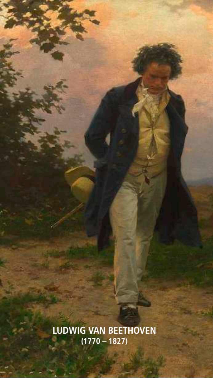
LUDWIG VAN BEETHOVEN (1770 – 1827)